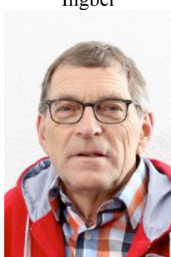
14. Hub Kockelkoren Mechelen