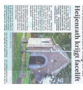
Monumentale kapel in Heijerath krijgt faciliteit

Onze gemeente heeft een van de hoogste dichtheden aan cultuurhistorische elementen van Nederland. Kalkovens, bakhuizen, moltes, brommen en groeven laten niet alleen het verhaal van de mens door de eeuwen heen zien, ze zijn ook van grote recreatieve waarde.